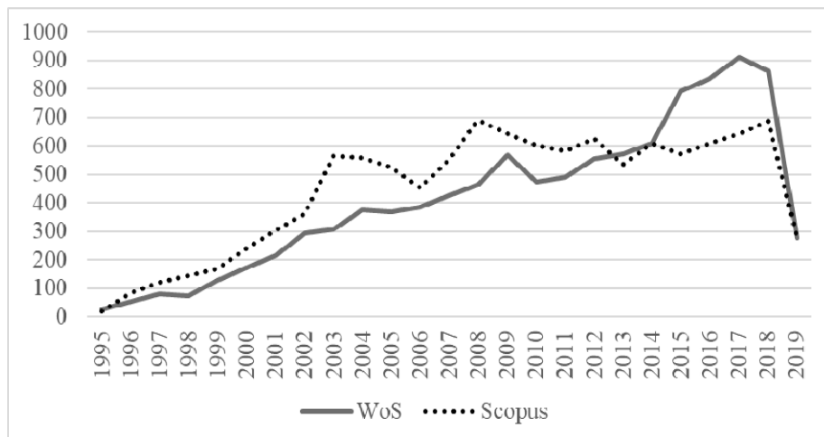
Figura 1. Evolución del número de publicaciones (1995-2019) de Internet Law

Un total trabajos de 11.191 en Scopus y 10.337 WOS hacen referencia a aspectos legales en relación a estudios sobre Internet, de los cuales tan solo 79 hacen referencia a trabajos de origen español. El interés de la comunidad científica por el uso de aspectos legales en sus trabajos ha crecido anualmente en los últimos veinticinco años como muestra la figura 1, pero especialmente en los últimos cinco años, llegando a cifras por encima de las novecientas contribuciones anuales en el año 2017.