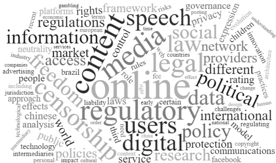
Figura 3. Palabras-clave relacionadas con la regulación de Internet

La importancia de los medios en Internet, así como la información, la censura, los contenidos y la libertad de expresión son aspectos clave para muchos de los estudios realizados sobre la regulación en Internet más vinculados al área de las ciencias de la información. El usuario, como sujeto a proteger, y la protección de datos, así como el acceso a la red y sus contenidos copan otro número importante de aportaciones. Por último, la política y gobernanza que garantice un acceso a la Sociedad de la Información, con garantías, supone otra línea de contribuciones importante.